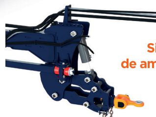
Sistema duplo de amortecimento